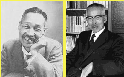
森田正馬 (1874～1938年) 高良武久 (1899～1996年)